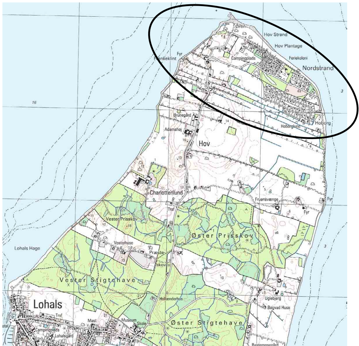
Hov Nordstrand, kortudsnit i mål 1:25.000

Mange af sommerhusene har tidligere tiders let romantiske anstrøg med en antydning af det cottage-agtige. Andre som er opført i 1920'erne og 30'erne refererer til både Bedre Byggeskik og funktionalismen.