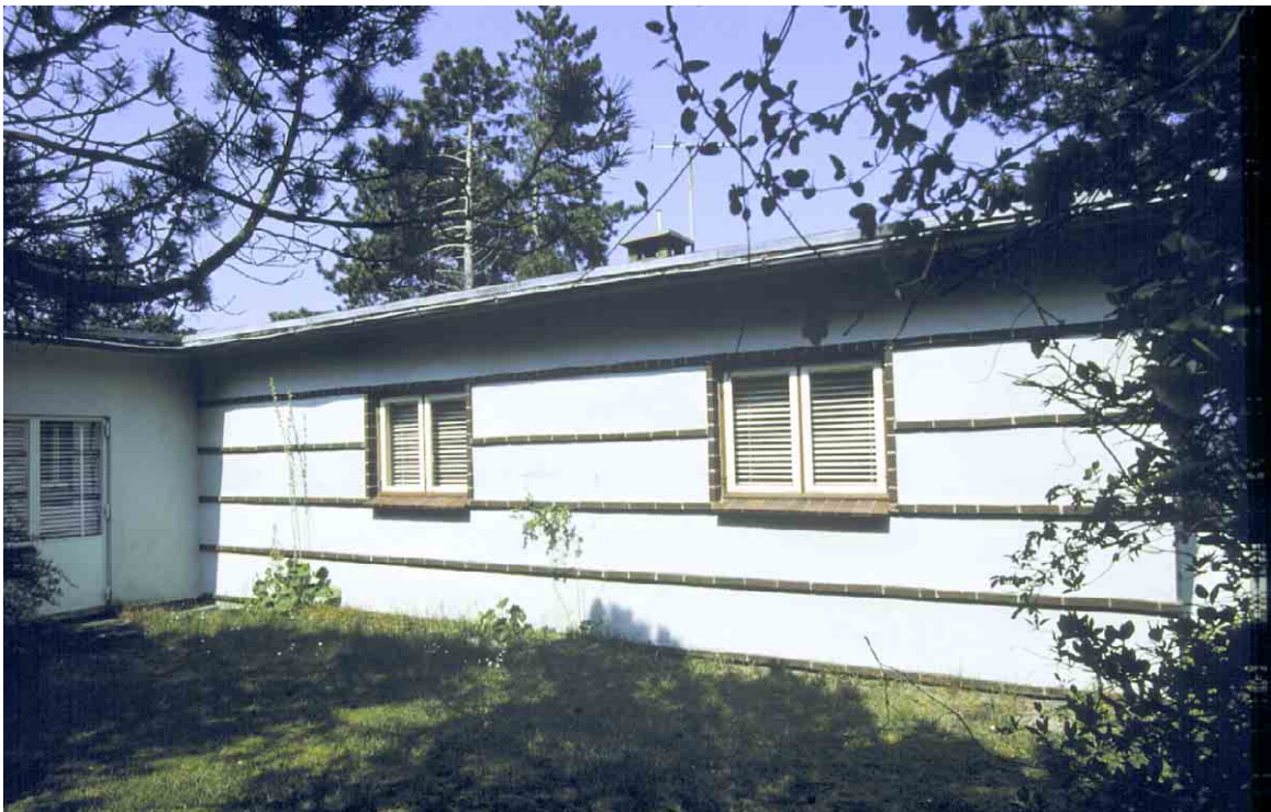
Sommerhus opført i 30'erne med klare funktionalistiske træk, betoningen af det horisontale og den lave taghældning.