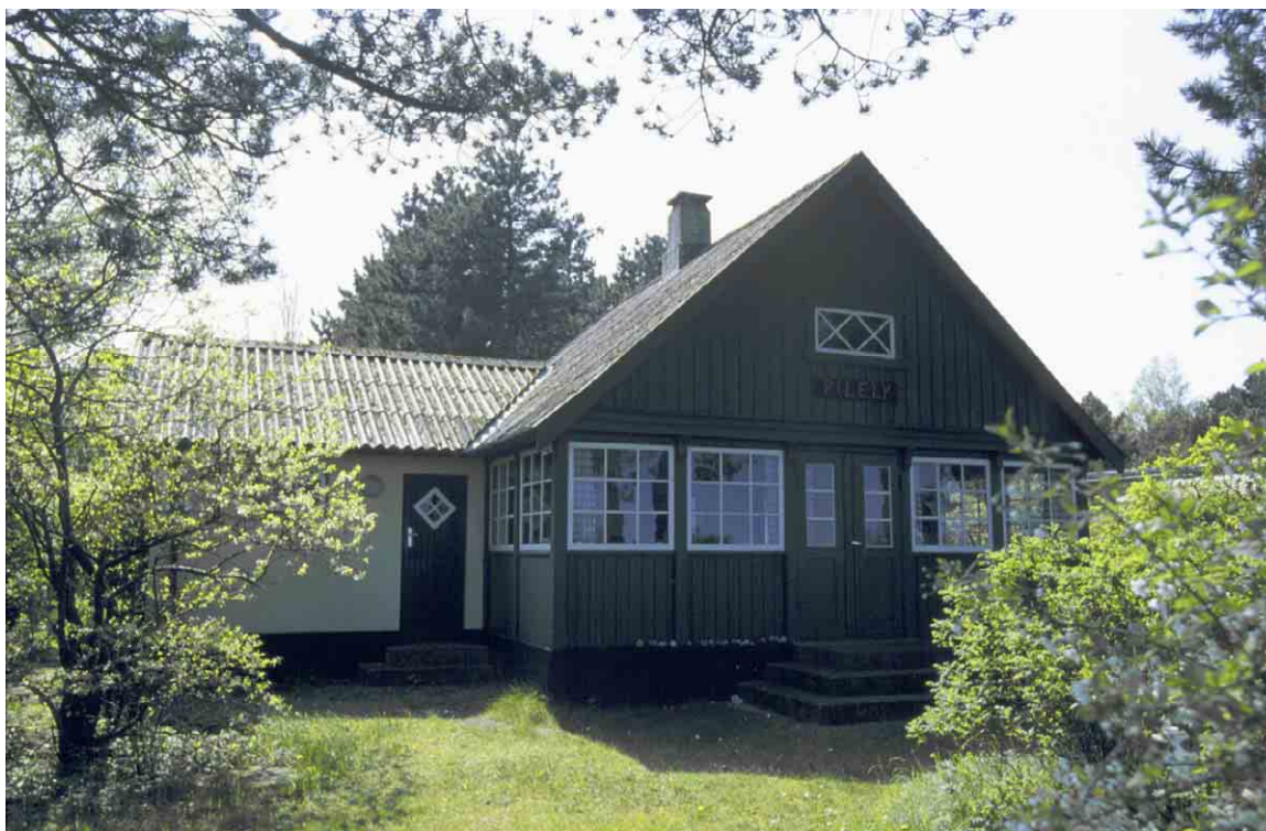
Sommerhus på Vesterled udformet med et tætstillet vinduesbånd på hovedhusets facader.

Det samlede miljø fremstår hyggeligt og rart med de veltilvoksede omgivelser.