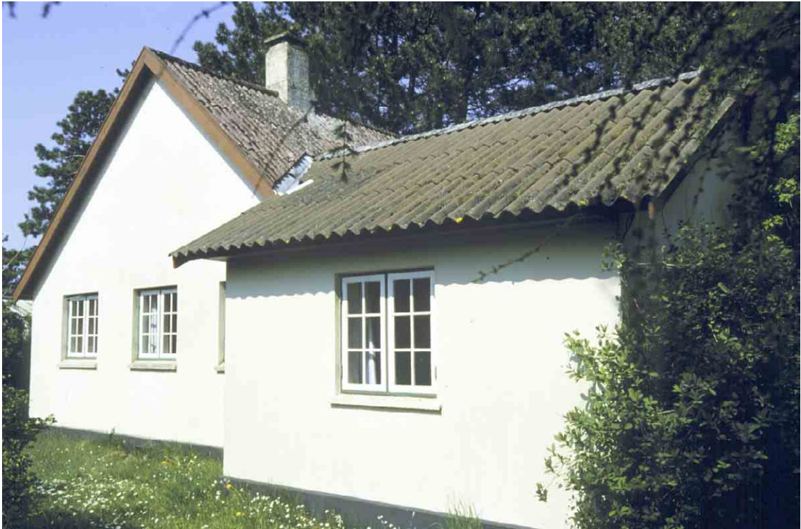
Typisk udformning af et ældre sommerhus med et stort hovedhus og et mindre anneks.

Kortlægning og registrering af kulturmiljøer