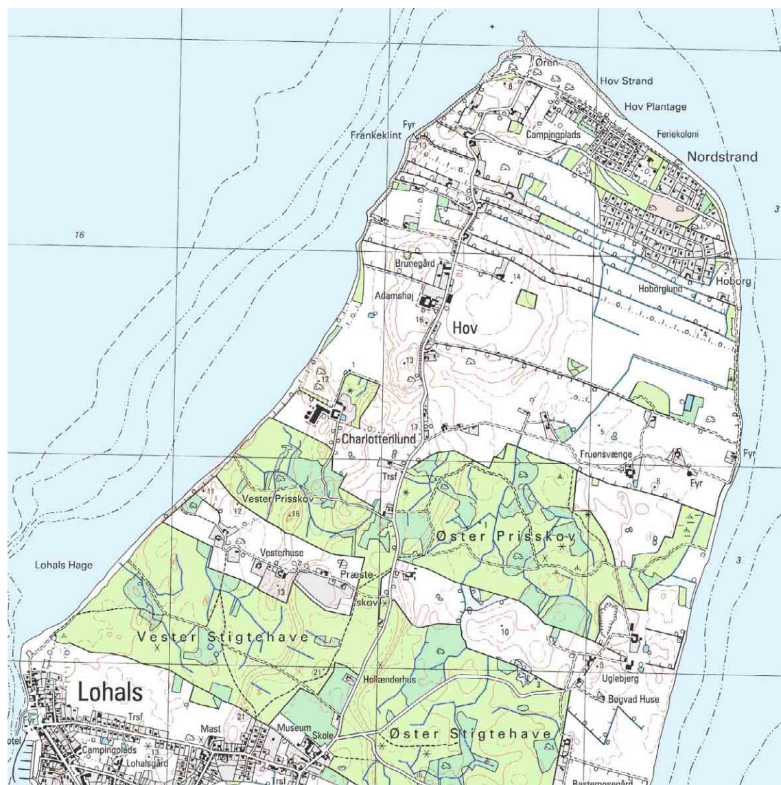
Hov Nordstrand, kortudsnit i mål 1:25.000

Jordbunden i Hov sogn er mest svagt bølget bundmoræne og bestrøet med kæder af hatbakker, der står med op til ti meter høje skrænter og flade topflader, som alle ligger i samme højde ca. 20 m over havet. På nordøstspidsen findes Frankeklint på 14 m og med fyr og nordligere den lille, bratte skrænt Øren. Herfra og mod øst findes et stort marint forland med sommerhuskolonien Nordstrand eller Hov strand, Langelands mest kendte badestrand. Hov sogn er øens skovrigeste.